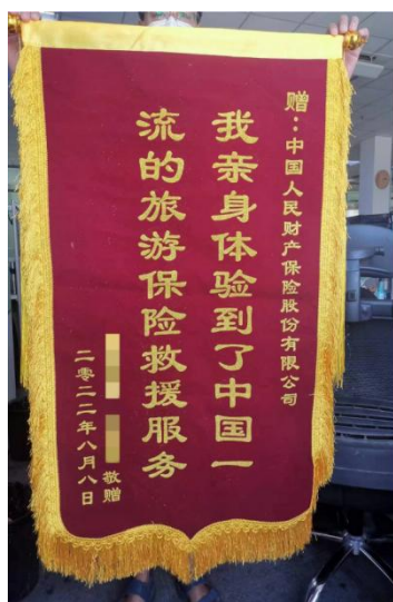
图 1 客户赠送锦旗